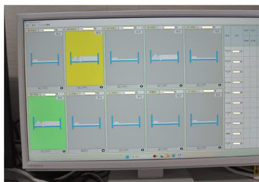
利用者様の状態がモニターに映ります