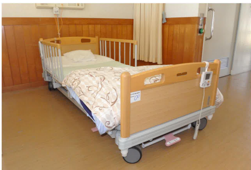
ベッド上の利用者様の動きを感知できます

JKA 競輪補助事業のご支援・ご協力のもと、当施設に最新のベッドが10台導入されました。