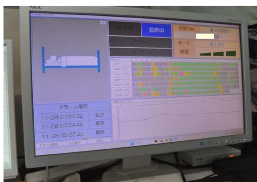
モニターにて離床時間も記録できます