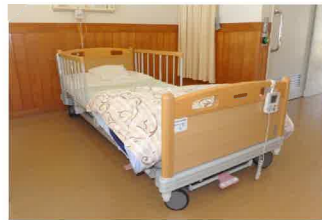
最新の介護用ベッド