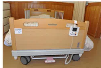
ベッド上の利用者様の動きを感知できます